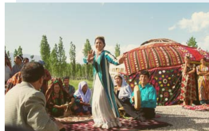
DANZE TRADIZIONALI DAVANTI AD UNA YURTA

Dipartimento di Italiano • Samarcanda • 703000 • 93, Akhunbabayev Street • upi@rol.uz •